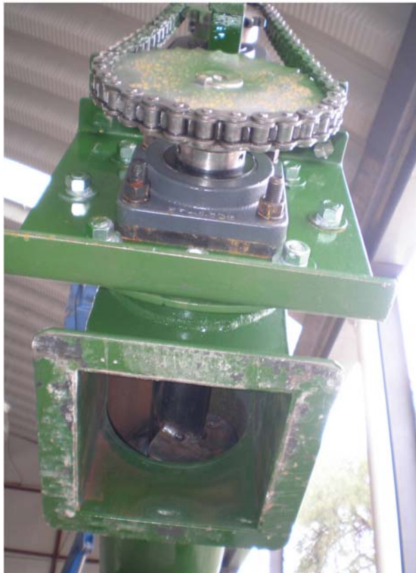
b) Engranajes de motor a helicoide, accionada por cadena, mostrando la salida del material transportado.